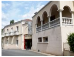
Passions et Gourmandises A St Benoît