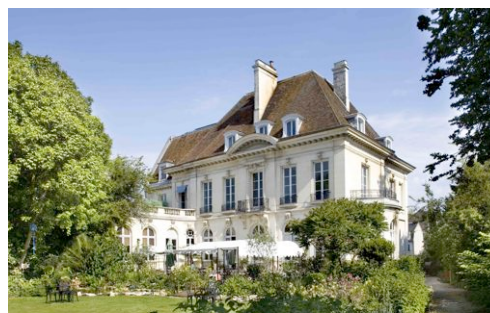
La Gourmandine nous recevra en 2014