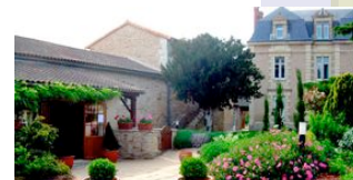
Le Logis de Pompois nous a accueillis en 2013