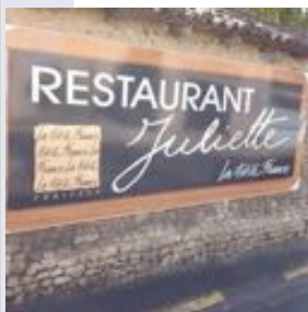
La Petite France, au restaurant chez Juliette, pour les ASVs le 3 avril 2018