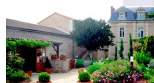
Le Logis de Pompois nous accueille en 2018