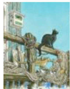
Cardio à Arcachon

29/11/18 au 01/12 : Marseille, CONGRÈS NATIONAL : les complications, parlons en